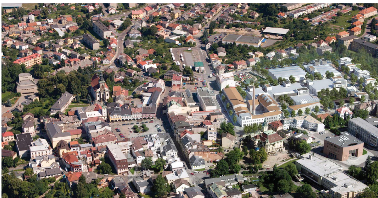
obr. 2: Perla 01 v Ústí nad Orlicí – celkový pohled na území, revitalizované podle návrhu MS plan; zakres do fotografie MS plan