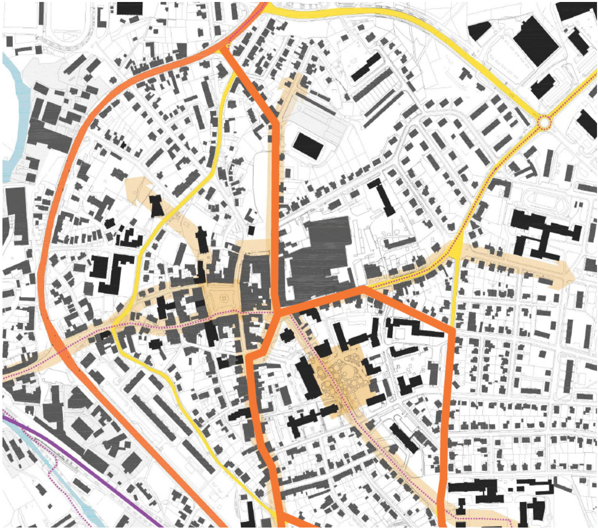
obr. 3: areál Perla 01 (největší plocha souvislé zástavby, východně od náměstí) v kontextu nedobré dopravní situace v centru města; bariéra mezi náměstím a areálem Perly

Zapojení nově zakládaného veřejného prostoru regenerované lokality do struktury veřejného prostoru celého města bylo jedním z klíčových faktorů produktivní revitalizace. Dopravní situace v centru Ústí nad Orlicí nebyla dobrá. Analýzy ukázaly, že problémy dopravní propustnosti a negativních externalit intenzivní dopravy se do značné míry vztahují k perimetru areálu Perly 01. V rámci revitalizace areálu byla tedy navržena úprava a doplnění uliční sítě, která problémy řeší nebo výrazně mírní – zvyšuje průjezdnost a zátěž rozkládá rovnoměrněji – ulevuje tedy nejzatíženějším plochám. Změna provozu v Lochmanově ulici na jednosměrný umožnila vytvoření širších chodníků a doplnění stromořadí: spolu s dalšími opatřeními tak byla překonána bariéra v pěší komunikaci a Perla se funkčně připojila k centru města.