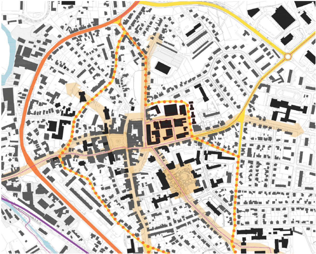
obr. 4: řešení dopravní obslužnosti centra města v kontextu revitalizace území Perla 01

Při trasování os a vytyčování profilů se uplatnil axiom historického bohatství : vícepodlažní blok v jihozápadním cípu areálu byl jako nejcennější ze stavebně-historického hlediska striktně navržen k zachování. Zbytek území prakticky bez mezer pokrývaly méně cenné haly. Veřejný prostor byl na něm rozvržen tak, aby protínal haly způsobem, který umožňoval zachování jejich částí mimo plochy veřejných prostranství. Konkrétní způsob rozvoje jednotlivých takto vymezených parcel byl ponechán na konkrétních budoucích stavebnících – jako přípustné byly navrženy jak rekonstrukce, adaptace, přestavby a přístavby, tak demolice a novostavby.