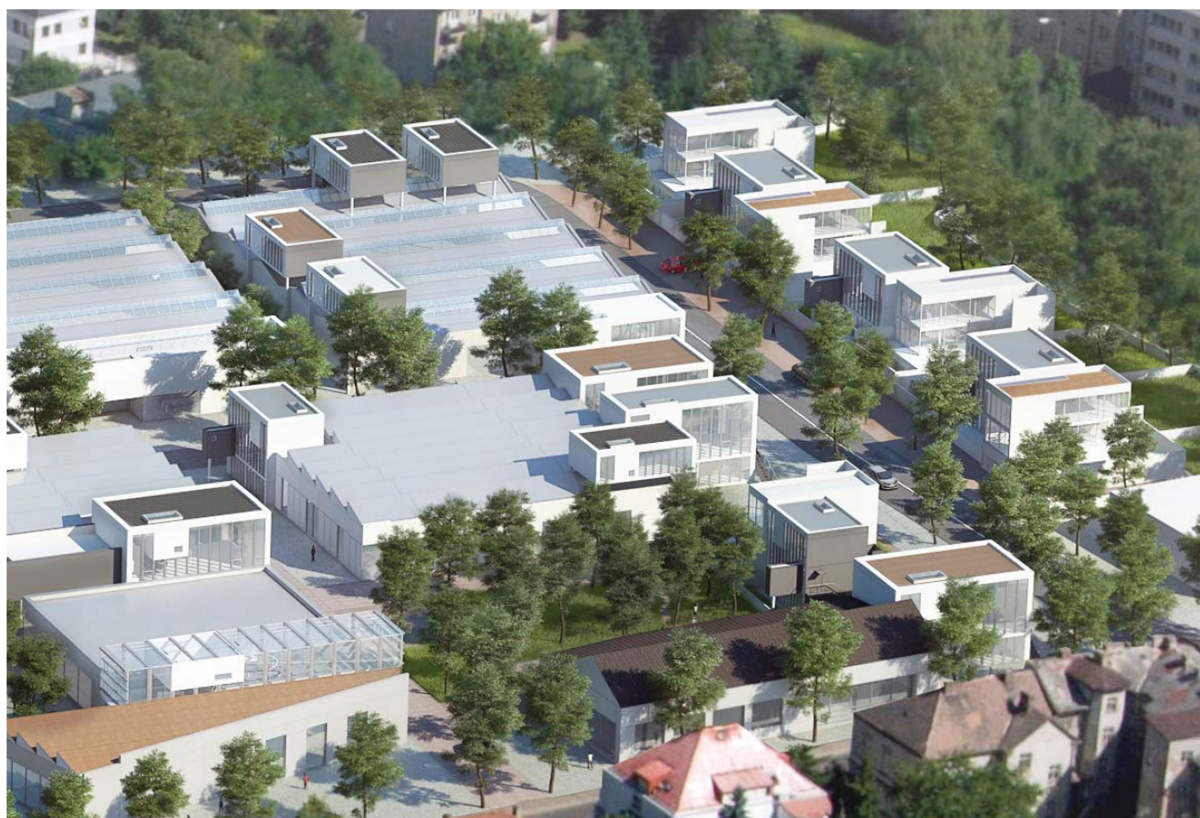
obr. 7: revitalizace areálu Perla 01: architektonická artikulace revitalizační koncepce; vizualizace MS plan