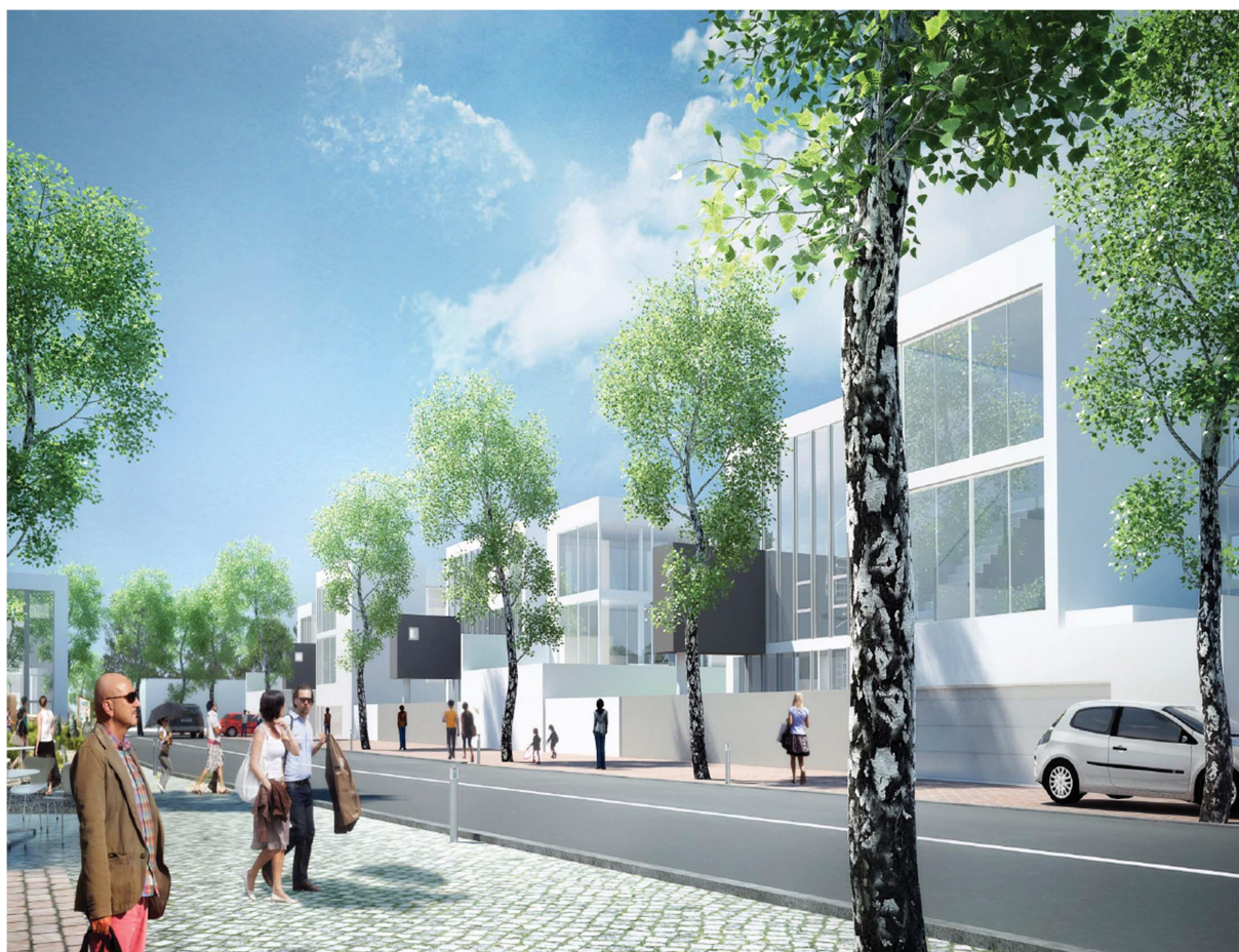
obr. 8: revitalizace areálu Perla 01: architektonická koncepce; vizualizace MS plan

Regionální i městská správa se tak zpronevěřily nejen axiomu historického bohatství , ale i zásadám udržitelného rozvoje, boje s klimatickou změnou a cesty k uhlíkové neutralitě , ke kterým se jinak mimo pochybnost hlásí; promeškaly příležitost uplatnit v praxi principy cirkulární ekonomiky s nepochybně velkým kladným efektem. Na straně vedení města je ovšem třeba připustit významnou polehčující okolnost: rozhodovalo se mezi přijetím anti-evropského, anti-udržitelného a anti-klimatického lehkovážného rozhodnutí Krajského úřadu na jedné straně a oddálením rozběhu realizace nové výstavby a tím i praktické revitalizace Perly 01 o roky na straně druhé. V praxi se tak uplatnil axiom dvojznačné a nerozdělitelné protikladnosti historického odkazu .