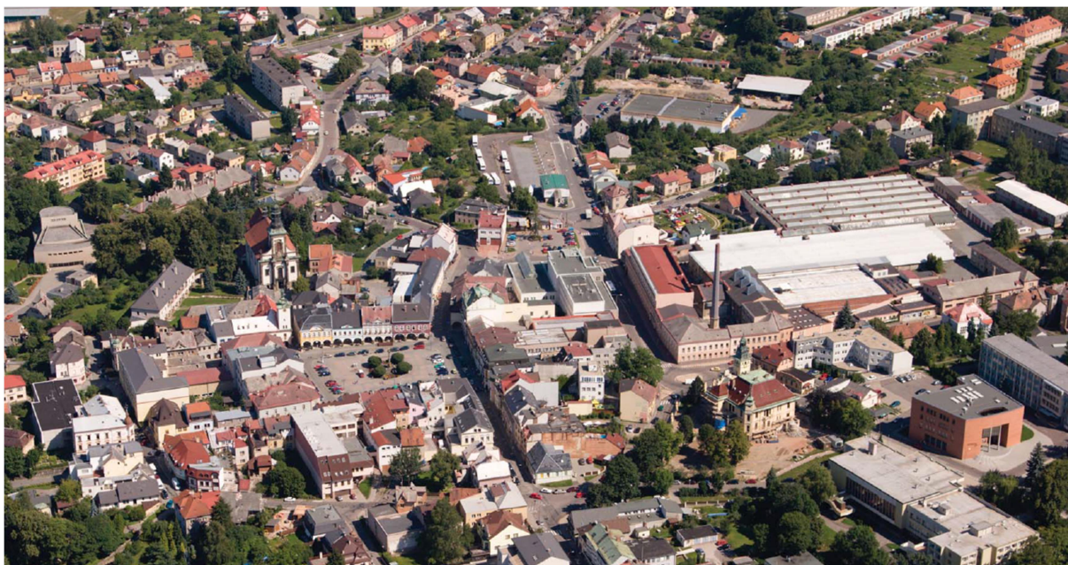
obr. 1: areál Perla 01 v Ústí nad Orlicí v roce 2014