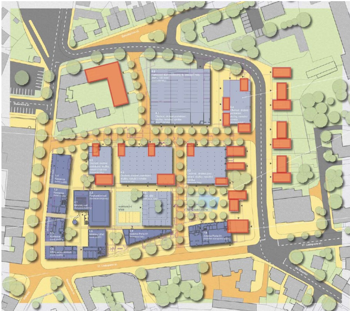
obr. 5: revitalizace území Perla 01: návrh prostorového uspořádání; archiv MS plan